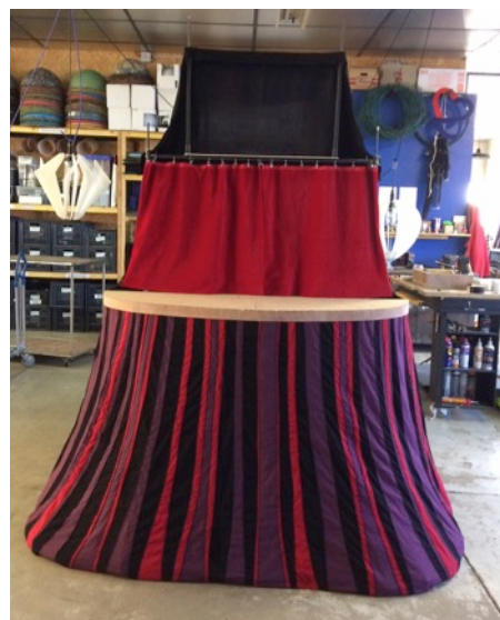
étape de construction